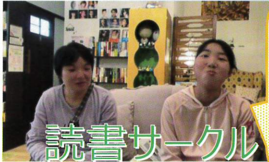
読書サークルは本に親しむことを目標にしています。図書館、喫茶室などに行っています。