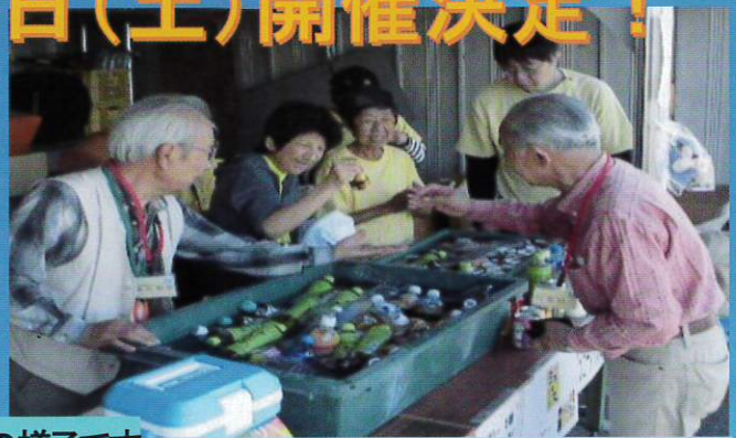
写真は昨年の様子です