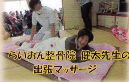
らいおん整骨院 健太先生の 出張マッサージ