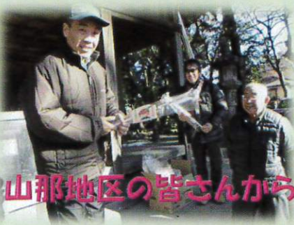
山那地区の皆さんから破魔矢をいただきました