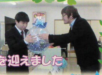
ふそう福祉会では今年お二人が成人を迎えました