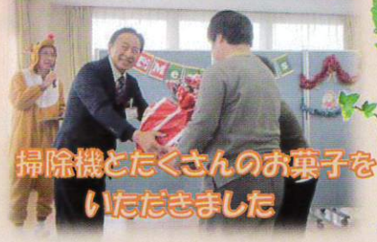
掃除機とたくさんのお菓子を いただきました