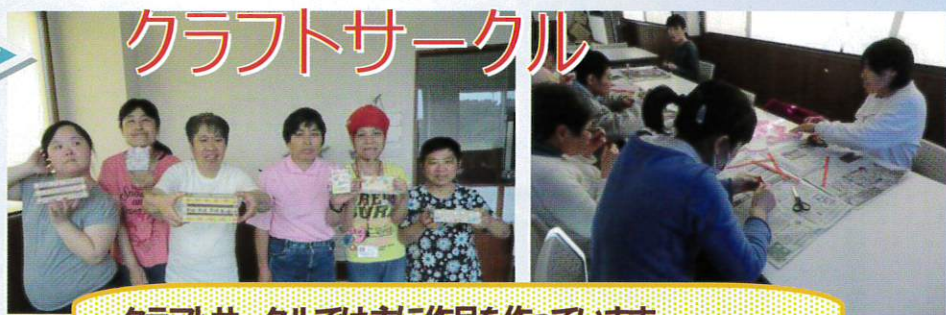
クラフトサークルでは主に作品を作っています。今回は小物入れをアレンジして作りました。どうですか...