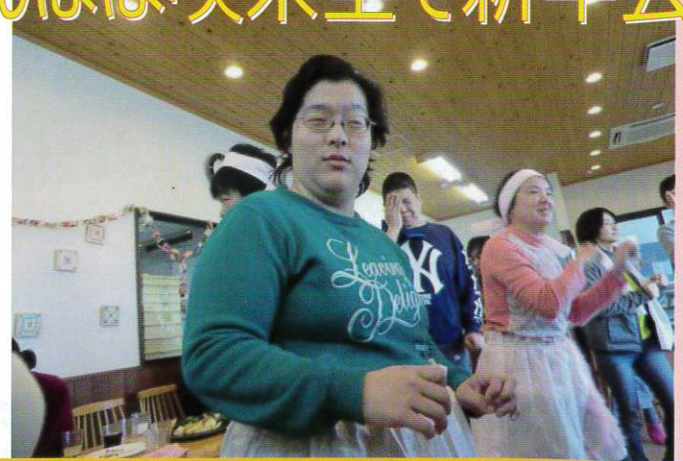
今年はベーカリーたんぽぽの喫茶室で新年会をしました。新年のスタートをみんなでファイファイ!!! お寿司こオトブル! ジュースで乾杯! カラオケに合わせて歌たり踊ったりして楽しい新年会になりました。