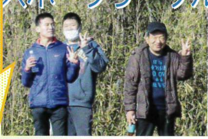
スポーツサークルは健康を意識して元気に歩くことを主体にしています。汗を流した後の飲み物は最高です