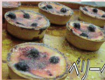
ベリーベリーチーズタルト ¥150